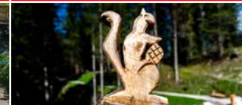
Schnitz-Figuren zum Bestaunen Various carved figures to admire

Zurück an der Bergstation lädt das Tirolerhaus mit seiner großen Sonnenterrasse zur Einkehr ein.