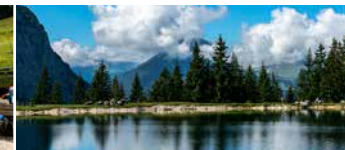
Bänke und Liegen zum Entspannen Benches and loungers to relax