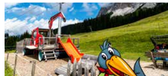
Pistenraupe aus Holz zum Spielen A wooden snow groomer

There is lots for you to see and do along the way: