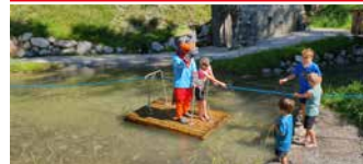
Wasserspaß mit Zieh-Floß Water fun with a raft